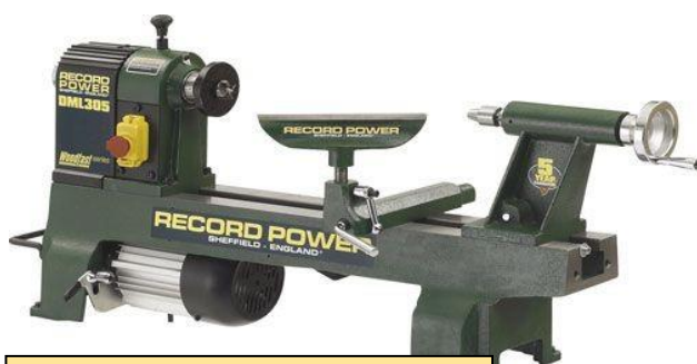
DML-305-M33-EP (Fr. 473.00) Aktion: Fr. 451.00