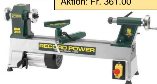
DML-250 «das Einsteigermodell» (Fr. 383.00) Aktion: Fr. 361.00

Alle Preise inkl. 8,1 % MWST – Preis- & Modelländerungen vorbehalten, Oktober 2024