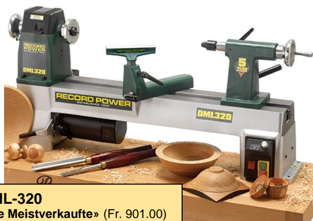
DML-320 «die Meistverkaufte» (Fr. 901.00) Aktion: Fr. 845.00

Massive Gusskonstruktion und somit hohe Laufruhe, ab dem Einsteigermodell DML-250